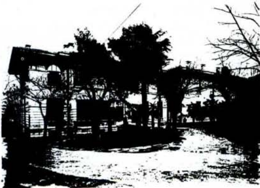
Resim 1: Haseki Hastanesi, Nurettin Bey Pavyonu üst kat tüzümü ile ortopediye ait