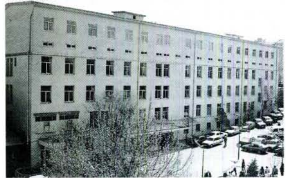
Resim 5b: İ. Ü. İ. T. F. Ortopedi ve Travmatoloji kliniği şimdiki modern binası görülmektedir

27.4.1933'de kurulan ilk Ortopedi Cemiyeti. Sene-lerce kendisini toparlayamadı. Son 20 senedir gittikçe güçleşiyor. Bu çaba artacak ve daha güçlü duruma gelecek. Acta Orthopaedica et Traumatologica Turci-ca ilk sayı 1962 Eylül-Ekim sayısı. Aksayarak çıkabili-yordu. Ama, 1-20 senedir, gittikçe gelişerek devam eden, beğeni kazanan, bugün için, sahamızda, tek mecmua. Bütün zorluklara rağmen, mecmuanın, her yönü ile kalitesini bozmadan çıkmasını sağlayanlara binlerce teşekkürler.