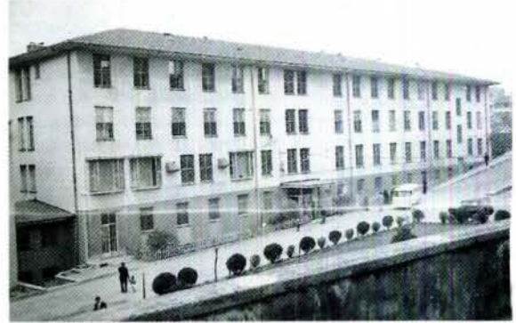
Resim 5a: İ. Ü. İ. T. F. Ortopedi ve Travmatoloji kliniği eski hali görülmektedir