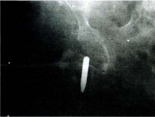
Resim 2: Ossacryl protezi

Savaşlar, tıbbı bir çok yenilikler getiriyor. Antibiyotikler, sulfamidler, ortez-proteze geniş atılımlar, yeni teknikler, Kütscher, kendi ismini alan çivisini 1939' da geliştirdi. Harp senesinde, Türkiye' de Nejat Evren, Almanya' da yetiştiği için, tanıdıkları yolu ile parça halinde, o zamanın en iyi malı olan V2 A çeliği çubuk ve parçalarını getirtebiliyor. Burada çivi ve plakların aynı yapıyor. Biz de kırıklarda kullanıyorduk. Gelen bu V2 A parçalarından tarif ve model göndererek bir sürü çeşitli ortopedik ameliyat materyeli de yaptırabiliyorduk. Kaynak geliştirmek için frezeler filan olmadığından, Kütscher çivisini üç dayanaklı duruma getirecek şekilde inhina verirdik. Harp